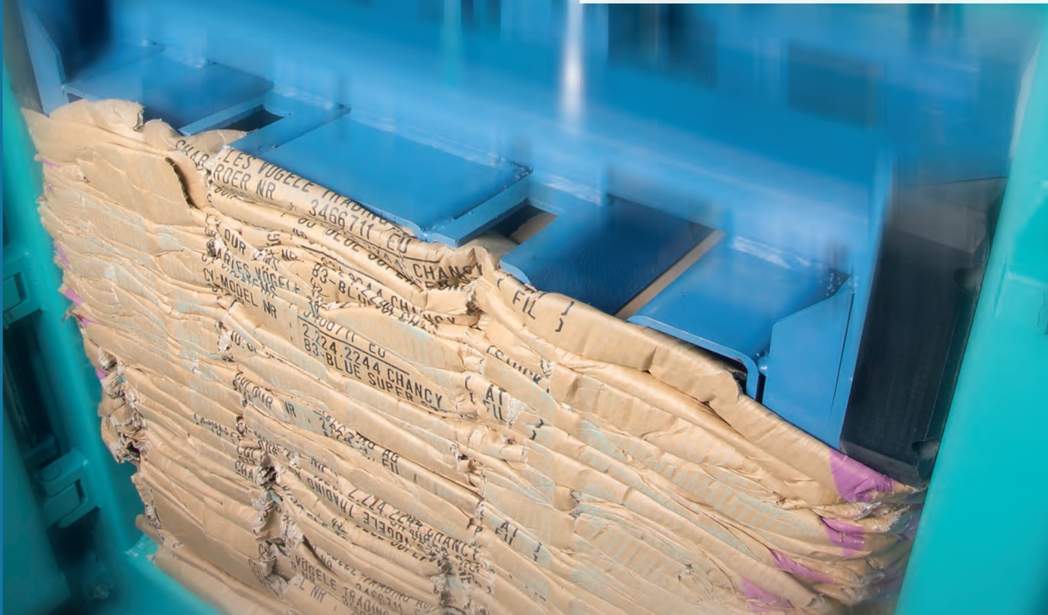
vertikálne balíkovacie lisy